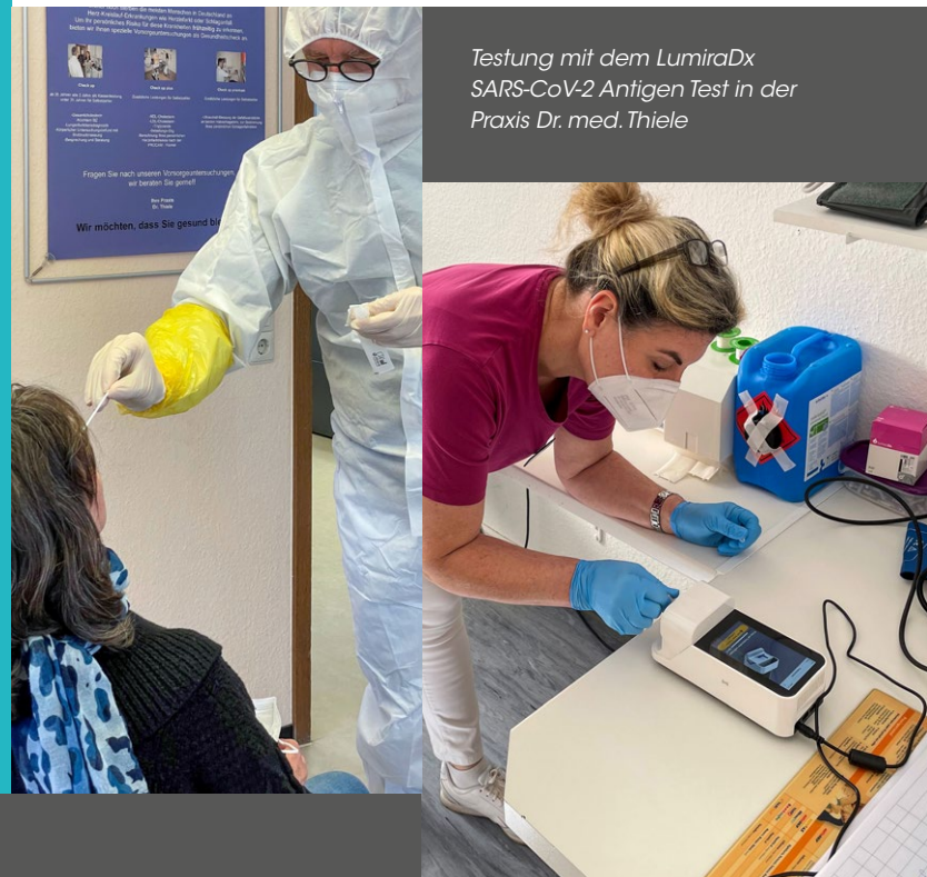
Testung mit dem LumiraDx SARS-CoV-2 Antigen Test in der Praxis Dr. med. Thiele

Die Praxis bietet ihren Patienten werktätlich die Möglichkeit an, sich mit Hilfe des LumiraDx SARS-CoV-2 Antigen Tests auf eine eventuelle SARS-COV-2-Infektion untersuchen zu lassen. Die Tests werden im Rahmen einer Infekt-Sprechstunde nach erfolgtem Einverständnis und telefonischer Terminvergabe bei Patienten mit jeglicher Infekt-Symptomatik durchgeführt. Im Auftrag der KV übernimmt die Praxis zudem die wöchentliche Testung von Lehr- und Erziehungspersonal. Nach Vorbild eines Drive-In wird den Personen im Auto sitzend ein Abstrich durch eine medizinische Fachkraft entnommen und in der Praxis direkt mit dem SARS-CoV-2 Antigen Test auf der LumiraDx Plattform getestet. Da das Testergebnis bereits in weniger als 12 Minuten vorliegt, können die Patienten im Auto auf die Mitteilung des Ergebnisses warten. Bei einem positiven Ergebnis wird zur Bestätigung ein PCR-Test im Labor veranlasst. Auch die Mitarbeiter der Praxis werden einer mindestens wöchentlichen Testung unterzogen, um eine größtmögliche Sicherheit für das gesamte Team zu gewährleisten.