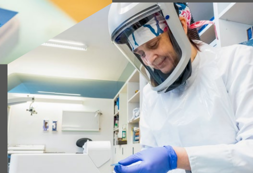
Durchführung des LumiraDx SARS-CoV-2 Antigen Tests in Schutzausrüstung