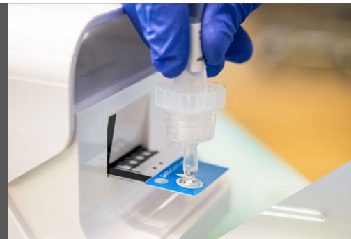
Testung mit dem LumiraDx SARS-CoV-2 Antigen Test in der Praxis Dr. med. Buchali

Mit einer reinen Bestellsprechstunde sorgt die Privatarztpraxis für einen gezielten Patientenfluss. Mit der Einhaltung strenger Hygieneregeln und der räumlichen Trennung der Patienten wird für einen maximalen Infektionsschutz gesorgt. Grundsätzlich werden alle Patienten zunächst als potenziell infektiös eingestuft. Sie erhalten eine Messung der Körpertemperatur vor Zutritt zu den Praxisräumen. Zudem wird bei Patienten mit jeglicher Infekt-Symptomatik nach erfolgter Aufklärung und Einverständnis des Patienten zusätzlich ein Abstrich für die Durchführung eines SARS-CoV-2 Antigen Tests auf der LumiraDx Plattform entnommen. Die Untersuchung von potenziell infizierten Patienten wird grundsätzlich mit voller Schutzausrüstung in einem von der normalen Sprechstunde separierten Behandlungsraum durchgeführt. Frau Dr. Buchali führt zunächst die initiale endoskopische Untersuchung durch und entnimmt dann eine nasale Abstrichprobe, die dann von einer medizinischen Fachkraft entgegengenommen und getestet wird. Bei einem positiven Ergebnis folgt eine Meldung an das Gesundheitsamt, die Veranlassung eines PCR-Bestätigungstests im Labor und die unverzügliche Einleitung der häuslichen Quarantäne bzw. Isolierung. Bei einem negativen Testergebnis wird der Patient als „nicht infektiös“ bzgl. SARS-CoV-2 eingestuft. 1